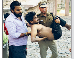
रेवाड़ी। लोगों को जागरूक करते हुए पुलिस टीम।