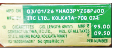
नारनौल। सिगरेट की डिब्बी पर पूरी डिब्बी व एक सिगरेट के छपे टैट।

■ गोल्ड फ्लैक की सभी टैक्स लागू करने उपरांत 10 रुपये वाली एक सिगरेट बेची जा रही 15 रुपये में