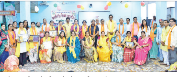
नारनौल। कार्यक्रम में महिलाओं को सम्मानित करते हुए।