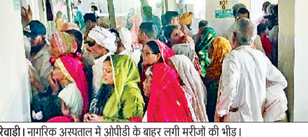
रेवाड़ी। नागरिक अस्पताल में ओपीडी के बाहर लगी मरीजों की भीड़।