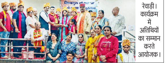
रेवाड़ी। कार्यक्रम में अतिथियों का सम्मान करते आयोजक।