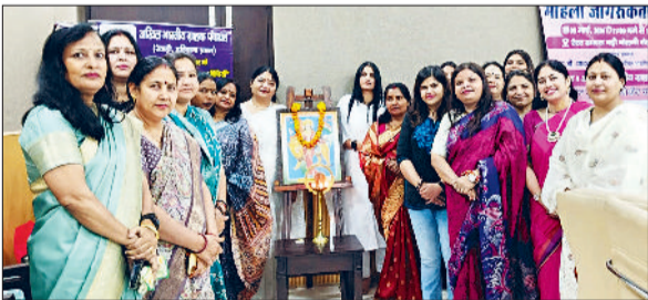
रेवाड़ी। कार्यक्रम में उपस्थित महिलाएं।