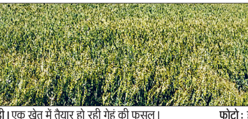
रेवाड़ी। एक खेत में तैयार हो रही गेहूं की फसल।

हरिभूमि न्यूज ▶▶ रेवाड़ी मार्च माह में गर्मी पिछले सभी रिकॉर्ड तोड़ रही है। अर्से बाद माह की शुरूआत में पहली बार पारा लगातार बढ़ रहा है। इस समय तापमान सामान्य से 5 डिग्री ज्यादा बना हुआ है, जिससे गेहूं उत्पादक किसानों की चिंता बढ़ रही है। मौसम में 9 मार्च को बदलाव देखने को मिल सकता है। आंशिक या घने बादलों के बीच बूंदबांदा की संभावना जताई जा रही है, परंतु इसके बाद भी तापमान में ज्यादा गिरावट के आसार नजर नहीं आ रहे। इस साल फरवरी के अंत में ही मौसम गर्म होना शुरू हो गया। 22 फरवरी के बाद से पारा लगातार 30